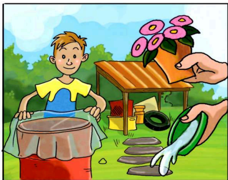
METTI AL RIPARO DALLA PIOGGIA TUTTO CIÒ CHE PUÒ RACCOLGERE ACQUA.

(*) Leggi attentamente le istruzioni riportate sulle confezioni.