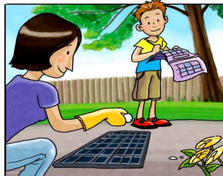
RICORDATI DI TRATTARE I TOMBINI CON PASTIGLIE DI INSETTICIDA, NEL PERIODO DA APRILE A SETTEMBRE. (*)